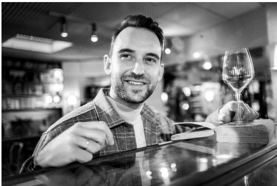
JOËL DICKER, Schriftsteller Paris, Frankreich, 2020

In der Ausstellung entdeckt das Publikum, wie die Walliser Weine Persönlichkeiten aus aller Welt begeben.