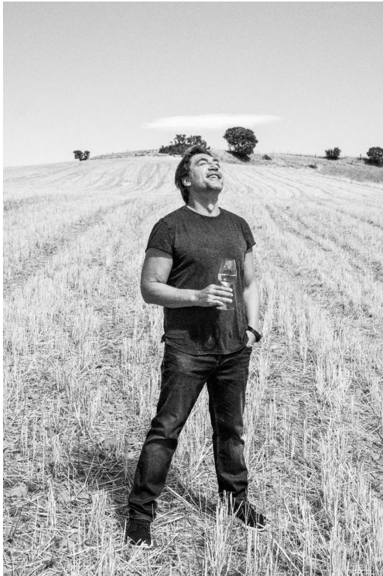
JAVIER BARDEM, Schauspieler Madrid, Spanien, 2020