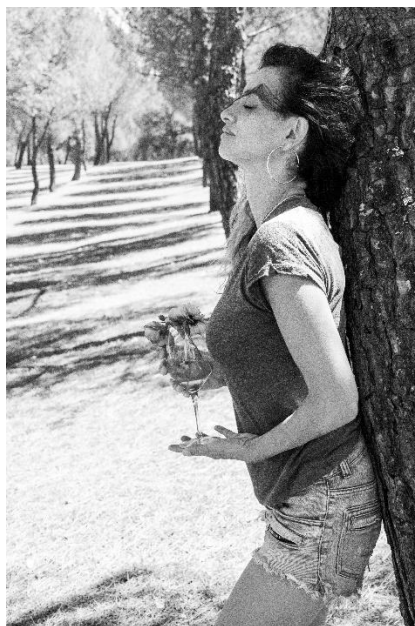
PENÉLOPE CRUZ, Schauspielerin Madrid, Spanien, 2020