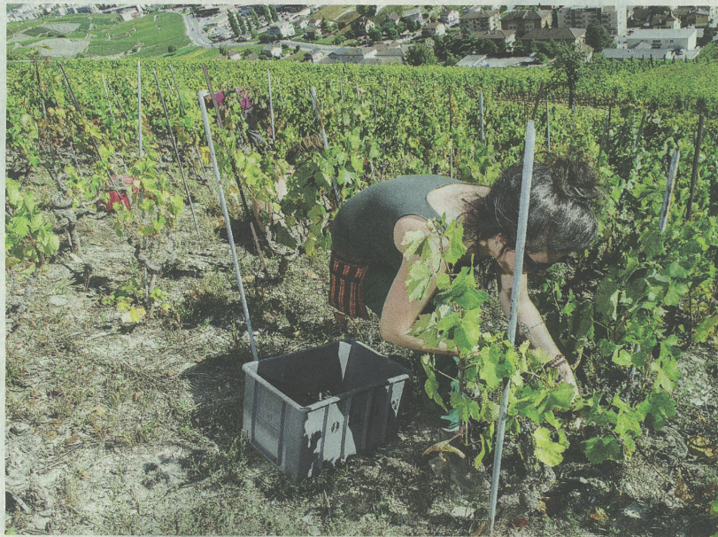
Samedi prochain, 34 encaveurs du Valais accueilleront des vendangeurs d'un jour dans une ambiance conviviale. SACHA BITTEL