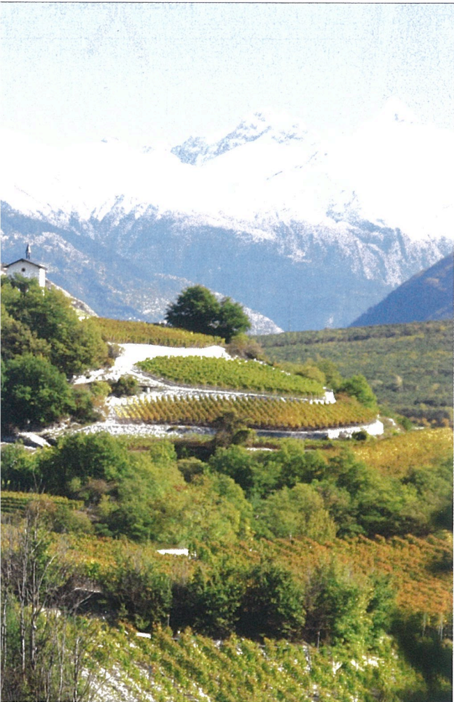
De Alpen lonken in de omgeving van Salgesch.