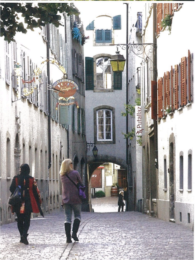
De historische binnenstad van Sion.