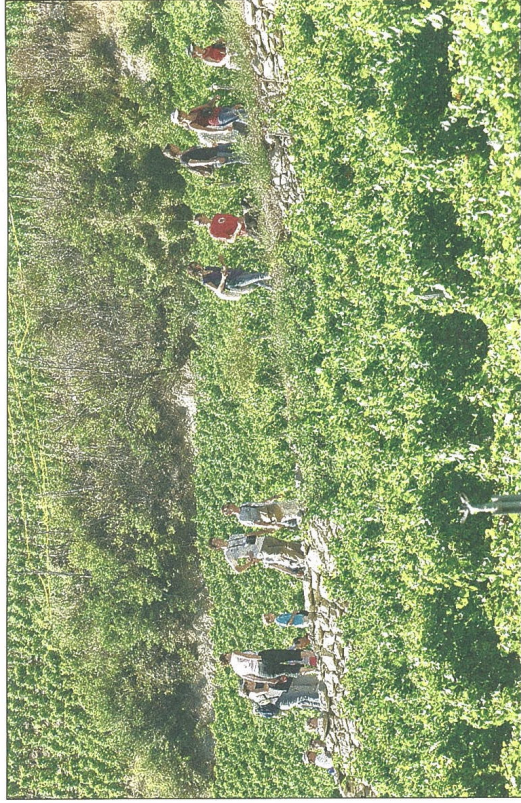
Le Tour de la vigne et du vin en un jour aura lieu le dimanche 12 juin, entre Salquenen et Siere. Une balade culturelle à travers le vignoble pour comprendre le Valais viticole d'avant le XX e siècle.