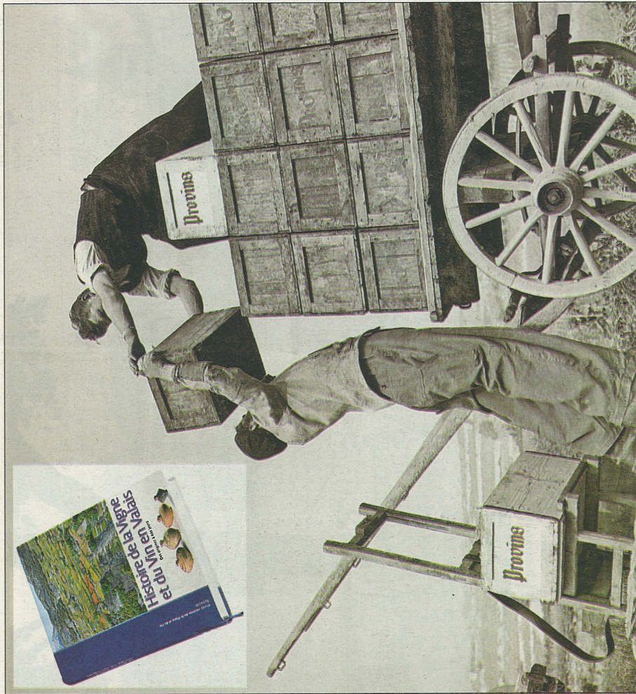
Das Buch (kleines Bild) gibt eindrückliche Geschichten und Bilder über die Walliser-Weingeschichte wieder.

Ganze 4000 Exemplare in französischer Sprache sind gedruckt worden. Die deutsche Fassung will man im Frühjahr realisieren, verspricht Stiftungspräsident Amédée Mounir. Gedruckt wurde das Buch bei Mengis Druck und Verlag. Ein Exemplar kostet 85 Franken. Auf 574 Seiten taucht der Leser in die Geschichte des Walliser Weins ein. Das Buch richtet sich an ein breites Publikum.