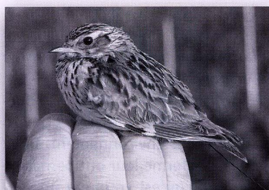
L'alouette lulu semble se montrer plus fréquemment dans les vignes valaisannes depuis que certains vigneron laissent pousser l'herbe.

Avec cette exposition, l'antenne valaisanne de la Station ornithologique suisse veut également sensibiliser les vigneron. On peut