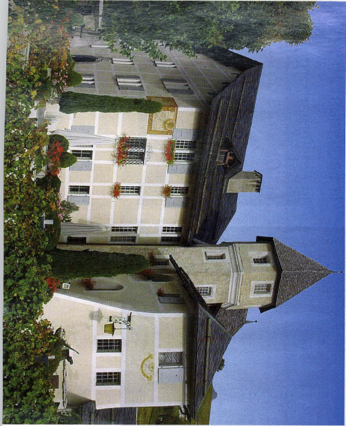
Château de Villa

Hôtel de la Poste Une architecture du XVIII e siècle et des chambres à thème qui fleurissent sur le chêne, le tilleul ou le mélèze. Un charme inattendu. Sierra. www.hoteldepostesierra.ch